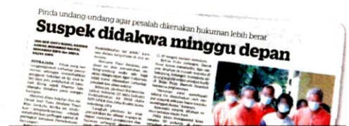
KERATAN Kosmo/ 6 September 2020.

Di mahkamah sama, seorang lagi lelaki berusia 30-an yang merupakan pekerja kilang terba-