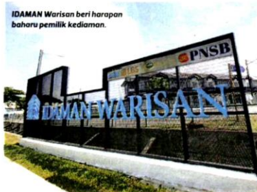
IDAMAN Warisan beri harapan baharu pemilik kediaman.