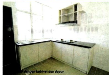
Sehinggal kabinet dan dapur.

Malah dia turut menasihati bakal pemilik kediaman supaya membuat kaji selidik rapi termasuk latar belakang pemaju bagi menjamin isu memabitkan kediaman terbenkakai tidak dihadapi mereka.