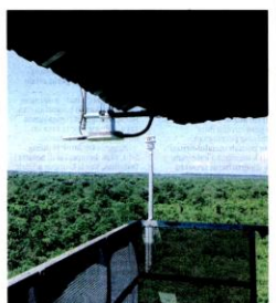
ANTENA LoRa dan stesen cuaca dipasang di menara untuk menghantar data paya gambut melalui IoT secara tanpa wayar.

terbakar dalam cuaca panas kerana ia mengandungi bahan organik yang boleh berubah dan mudah terbakar apabila kering. Tanah gambut terbentuk daripada sisa-sisa daun dan tumbuhan mati yang terkumpul di dalam takungan air. Jika seputing rokok teratoh di atas permukaan tanah gambut, ia boleh menyebabkan kebakaran bahkan ia boleh menyebarkan api masuk dengan begitu cepat dan sukar dipadamkan sehingga satu tahap ia boleh menjadi jerebu. Selain satu kawasan hutan paya gambut di negara ini, Hutan Simpan Raja Musa (HSRM) di Kuala Selangor, memancarkan beberapa kes kebakaran. Ia disebabkan oleh beberapa faktor termasuklah antaranya kemarau, penakutan tanah untuk tujuan pertanian, penekebunan hutan dan kecauan manusia. Antara kes kebakaran termasuk pada tahun 2011 apabila anggota bomba