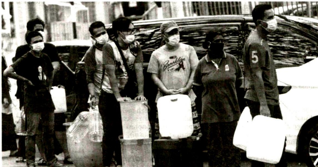
ORANG ramai beratur menunggu giliran untuk mengambil bekalan air bersih di Pusat Khidmat Setempat Seksyen 4, Shah Alam, Selangor pada 4 September lalu.