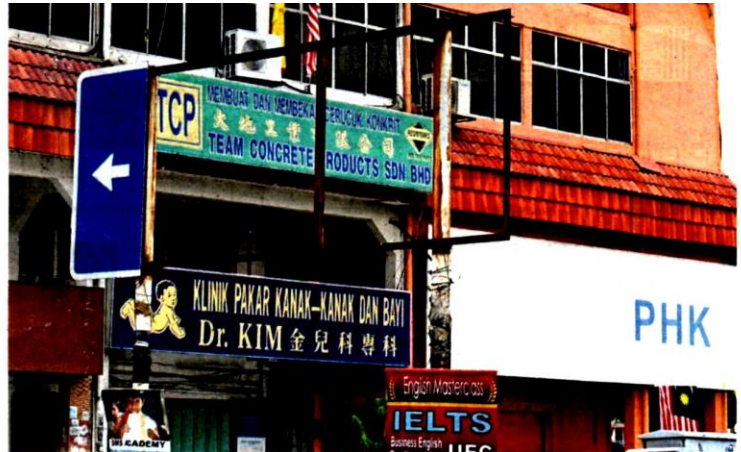
This signboard along Lebuhraya Turi off Persiaran Raja Muda Musa in Klang is partly missing.