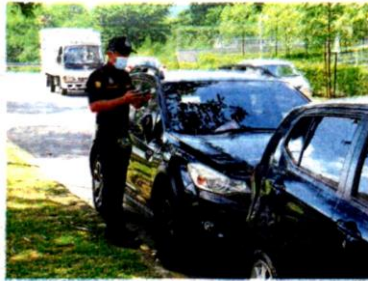
An enforcement officer issuing a summons for a car that was illegally parked during the joint operation.