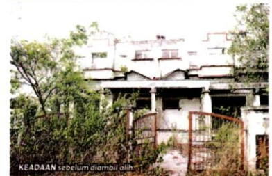
KEADAAN sebelum diambil alih.