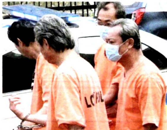
EMPAT pengurus kilang yang disyaki terbabit dalam pencemaran Sungai Gong disambung reman, semalam.

Pada Isnin lalu, dua pekerja lelaki sebuah kilang direman enam hari mulai 7 September lalu berhubung kejadian sama. - Bernama