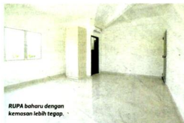
RUPA baharu dengan kemasan lebih tegap.