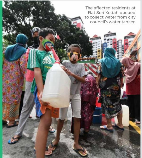
The affected residents at Flat Seri Kedah queued to collect water from city council's water tanker.

It said the probe will look into elements of corrupt practices involving any parties, including enforcement agencies.