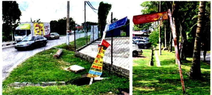
This street name sign at Jalan Teluk Pulai, Klang, has ended up in the drain. (Right) A faded street name sign at Taman Seri Teluk Menegun, off Jalan Kota Raja.

complaints; 57 last year and only seven up to Sept 3 this year," she said.