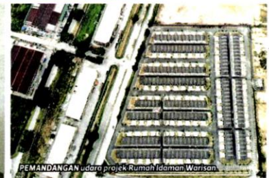
PEMANDANGAN udara projek Rumah Idaman Warisan.