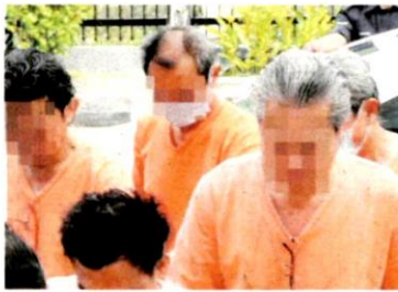
Keempat-empat suspek mencemarkan Sungai Selangor sehingga mencetuskan gangguan air baru-baru ini dibawa ke Mahkamah Majistret Selangor dekat Kuala Lumpur semalam.

KUALA LUMPUR - Tempoh tahanan reman empat pengurus kilang yang merupakan adik-beradik berhubung siasatan kejadian pencemaran sumber air di Sungai Gong, Rawang disambung lima hari lagi.