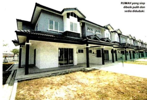
RUMAH yang siap dibaik pulih dan sedia diduduki.

berikutan ketika ini menyewa di lokasi selain anak bersekolah selain saya dan isteri berulang alik dari tempat kerja.