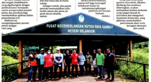
PADA penyelidikan dari UPM, MIMOS, jurutera-jurutera Loronet Technologies dan pegawai resjer hutan dari Jabatan Perhutanan Negeri Selangor (JPNS) di hadapan Pusat Kecekmerlangan Hutan Paya Gambut Negeri Selangor.

Mi-MIST, penerima dan sambungan tanpa wayar bagi melaksanakan penyelesaian yang berguna berterusan mengatasi masalah kehidupan sebegini. Platform Mi-MIST juga fleksibel dan digunakan untuk aplikasi dan projek lain seperti pembuatan pintar dan pertanian pintar. Realitiya, tanah gambut memancarkan gasrang sangat penting untuk ekosistem dan hablapan kita. Tanah gambut bertindak seperti span gergasi yang menyimpan karbon dan bertindak sebagai pemuliharaan biodiversiti, sistem keseimbangan hidrologi, mitiga banjir serta sumber bekalan air tawar dan produk semula jadi. Hutan paya gambut juga menjadi habitat kepada haiwan-haiwan terancam seperti burung malabar (Malayan sun bear), harimau kumbang dan tapir, serta membolehkan pokok-pokok unik seperti Xylocopa fulvipes dan perunggag (Crotalaria sp.). Sepereti hutan-hutan lain, hutan paya gambut menyimpan karbon dioksida dari atmosfera. Karbon ini akan dikunci dalam tanah, bahkan hutan ini menyimpan lebih banyak karbon berbanding jenis-jenis tumbuhan lain. Terjaga jika hutan paya gambut direbus, dibakar, ditinggalkan dan tanahnya dikeringkan, ia akan melepaskan karbon dioksida yang sangat banyak ke atmosfera dan mengancam ekosistem hutan kita, yang akhirnya memusnahkan pencemaran alam serta kerugian ekonomi dan sosial.