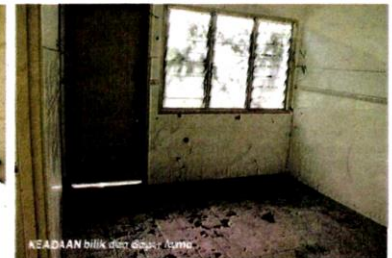
KEADAAN bilik dan dapur, lumpur.

"Rumah ini lebih kepada rumah persinggahan dan mungkin akan diduduki apabila bersara kelak