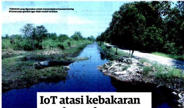
TERUSAN yang digunakan untuk memendapkan kawasan berlog di hutan paya gambut agar tidak mudah terbakar.